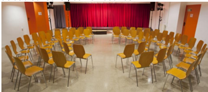
(Pie de foto: Sala de un centro cívico)

Así pues, se alivia el sobrecoste que tenemos las personas con discapacidad para desarrollar las acciones cotidianas que todos hemos de atender. En los casos explicados en torno a la Cultura, a la que tenemos derecho, pero también muchas dificultades para acceder, especialmente las personas con discapacidad sensorial, como nosotros.