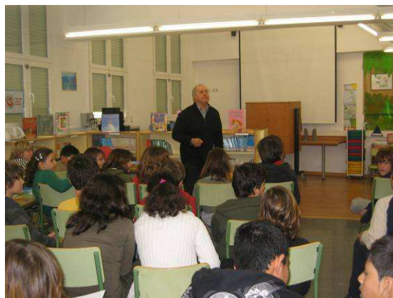
(Una classe a alumnes de primària)

L'Aula d'Estudis Socials (AES) és una entitat que sorgí l'any 1999 per a atendre l'Àrea d'Integració Social de l' Associació Discapacitat Visual Catalunya: B1+B2+B3 i ocupar-se de les tasques de formació que aquesta assumís, fent una gran tasca de sensibilització a escoles, estudiants de batxillerat, de Formació Professional i universitaris, així com de professionals en actiu. Aquest quadrimestre, ja desapareguts els crèdits de lliure elecció, hem fet un seguit d'accions formatives que han beneficiat 52 alumnes de formació superior, 70 alumnes de Grau Mig, uns 300 nens de Primària, 103 professionals, 5 voluntaris i 67 persones de formació indeterminada.