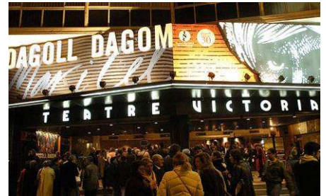
(Teatre Victòria, al Paral·lel)

Ja hi ha una cartellera regular d'espectacles en viu audiodescrits: Al Liceu, al Teatre Nacional de Catalunya, al Teatre Lliure, al Festival Grec de Barcelona, al Teatre Poliorama o al Victòria. En cinema, encara no n'hi ha cap d'adaptat, tot i les esperances que aporten iniciatives com la de Navarra de Cine i Fundación Orange, que comencen a oferir passis audiodescrits a moltes llocs d'Espanya. Altrament tenim la pàgina web www.cineaccessible.com per a conèixer l'oferta de títols audiodescrits i audionavegats en DVD, que compta ara mateix amb 39 pel·lícules i 150 curtmetratges.