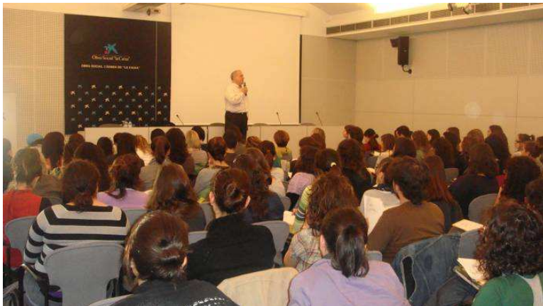
(Una classe en el marc del CaixaForum)

L'Aula d'Estudis Socials (AES) és una entitat que sorgí l'any 1999 per a atendre l'Àrea d'Integració Social de l' Associació Discapacitat Visual Catalunya: B1+B2+B3 i ocupar-se de les tasques de formació que aquesta assumís, fent una gran tasca de sensibilització a escoles, estudiants de batxillerat, de Formació Professional i universitaris, així com de professionals en actiu. Aquest quadrimestre, un cop desapareguts els darrers crèdits de lliure elecció, hem fet un seguit d'accions formatives que han beneficiat 121 alumnes universitaris o postuniversitaris, 83 alumnes de Grau Mig, uns 400 nens de Primària, 17 professionals i 21 voluntaris.