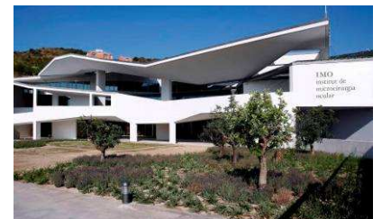
(Façana de l'IMO)