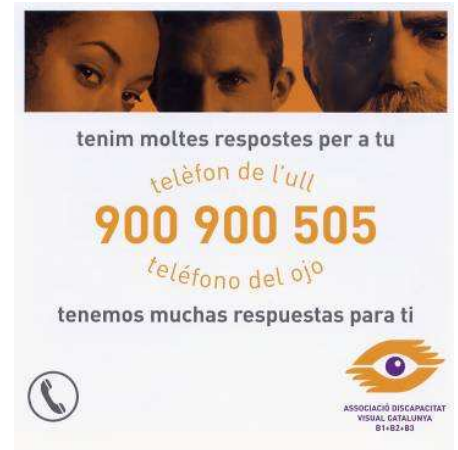
(Díptic del Telèfon de l'ull)

Atenem les consultes dels socis a través de la treballadora social, que deriva aquelles més específiques vers els altres professionals de l'associació. També resollem dubtes generals sobre atenció, drets i serveis a l'abast, a través del Telèfon de l'ull (900-900-505) , amb el què fem una tasca d'integració social del nostre col·lectiu, senzillament per a millorar la qualitat de vida de les persones que contacten amb nosaltres a través d'aquest nou servei. Penseu que el present quadrimestre hem atès 7 consultes de socis, 31 consultes de persones amb discapacitat visual, de les què 17 s'han fet sòcies i altres 4 consultes externes de professionals. Altrament s'ha entrevistat 18 persones interessades en fer voluntariat, de les què 15 s'han fet voluntàries nostres. Durant sis mesos, fins a l'abril, la Laia Blasco, estudiant d'Integració Social, ens va recolzar en el marc de les seves pràctiques formatives.