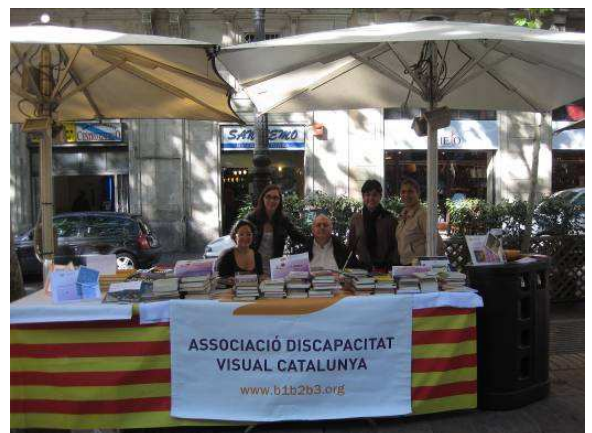
(Estant de la diada de Sant Jordi)