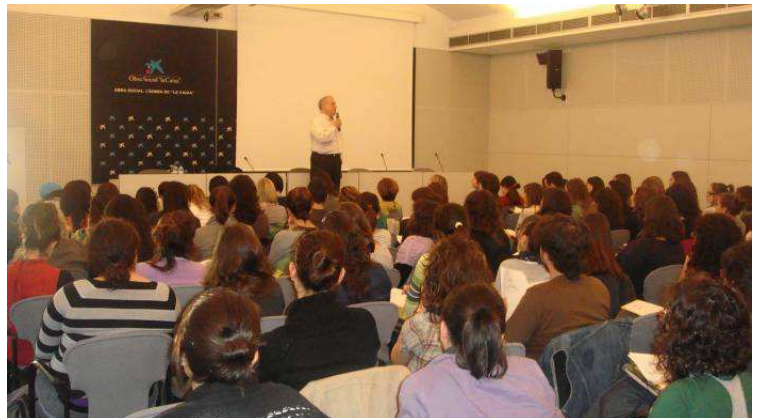
(Una classe en el marc del CaixaForum)

L'Aula d'Estudis Socials (AES) és una entitat que sorgí l'any 1999 per a atendre l'Àrea d'Integració Social de l' Associació Discapacitat Visual Catalunya: B1+B2+B3 i ocupar-se de les tasques de formació que aquesta assumís, fent una gran tasca de sensibilització a escoles, estudiants de batxillerat, de Formació Professional i universitaris, així com de professionals en actiu. Aquest quadrimestre, un cop desapareguts els vells crèdits de lliure elecció, hem fet un seguit d'accions formatives que han beneficiat 146 alumnes universitaris o postuniversitaris, 83 alumnes de Grau Mig, 50 alumnes de Primària i 41 professionals.