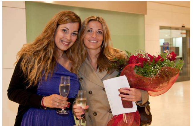
(La Yasmina al seu darrer acte amb nosaltres.)

En totes les nostres aparicions aprofitarem per a sensibilitzar la gent sobre les circumstàncies que envolten la discapacitat visual, les nostres dificultats, les nostres capacitats, i també reivindicar els nostres drets, sovint reconeguts per les lleis, però conculcats en la pràctica quotidiana.