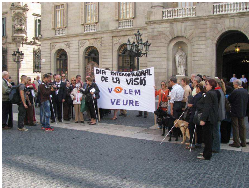
(Bastonada davant l'Ajuntament el Dia Internacional de la Visió de 2010)

Si algú havia pensat que les retallades no afectarien les associacions del Tercer Sector perquè els convergents havien promès mantenir les despeses socials s'haurà vist decebut. En el nostre cas les subvencions s'han reduït aproximadament a la meitat i no ens permetran de mantenir l'equip multidisciplinar pel què hem fet molts sacrificis i en el què havíem invertit molts diners i més esperances. Tornem a funcionar bàsicament amb voluntaris, alguns molt ben formats i, d'altres, amb molt bones intencions i ganes d'aprendre. Ara bé, hem de ser conscients que no és el mateix disposar de professionals que comptar amb la bona voluntat de voluntaris. L'any passat ens preocupàvem per la situació de les persones amb discapacitat visual al Tercer Món, ara també ens hem de preocupar per nosaltres.