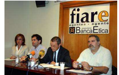
(Presentació de FIARE)