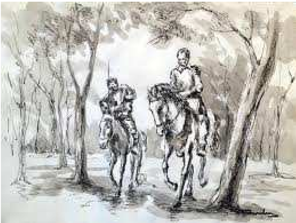
(Una il·lustració d'aquesta conegudíssima obra d'en Cervantes)