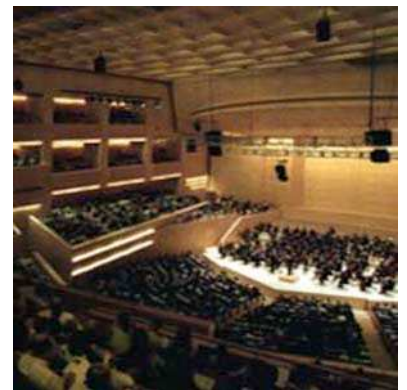
(Auditori de Barcelona)

Tornem a destacar aquest trimestre la iniciativa de l'Auditori de Barcelona, dita L'Auditori: Apropa . Ofereix a un preu molt assequible localitats preeminentes amb la intenció declarada d'apropar el fet musical als col·lectius que més dificultats en tenen. Mercès a aquesta iniciativa hem gaudit de l'audició de la Tercera Simfonia , " Heroica ", de Beethoven .