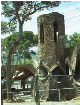
(Colònia Güell, campanari)