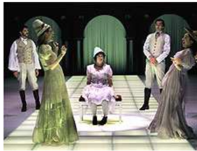
(Escena d'Yvonne, princesa de Borgonya)

També va ser audiodescrita l'obra Yvonne, princesa de Borgonya , de Witold Gombrowicz, representada al Teatre Lliure, si bé lamentem que, encara ara, les audiodescripcions siguin iniciatives puntuals per a produccions concretes i no quelcom regular.