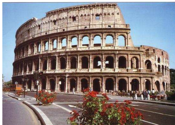
(Coliseu de Roma)