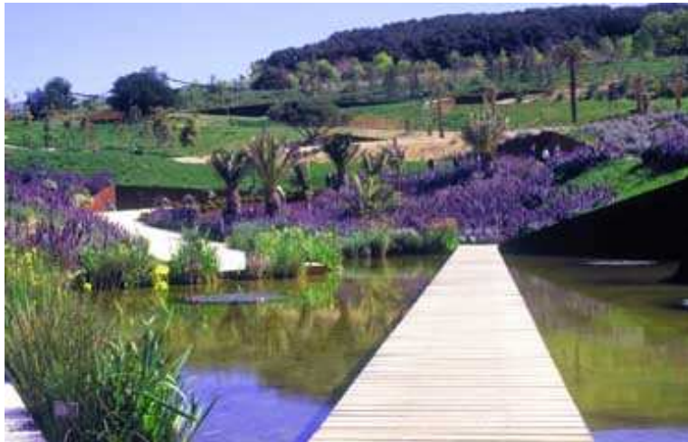
(Jardí Botànic de Montjuïc)